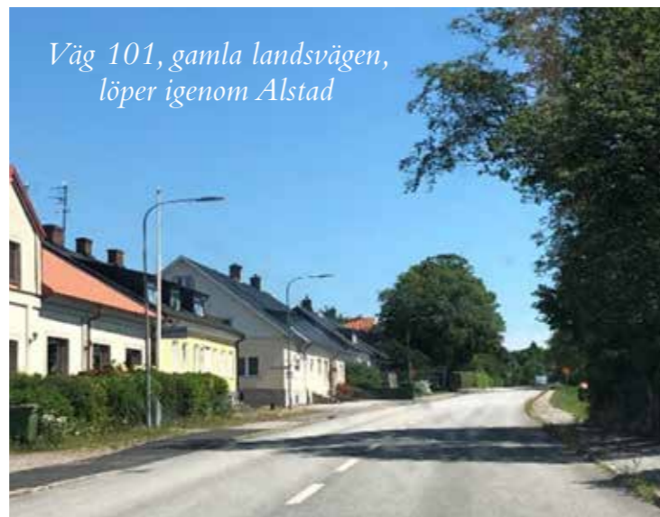
Väg 101, gamla landsvägen, löper igenom Alstad

Till sist har vi för golfspelaren Tegelberga golfklubb som ligger på bekvämt gång- och cykelavstånd!