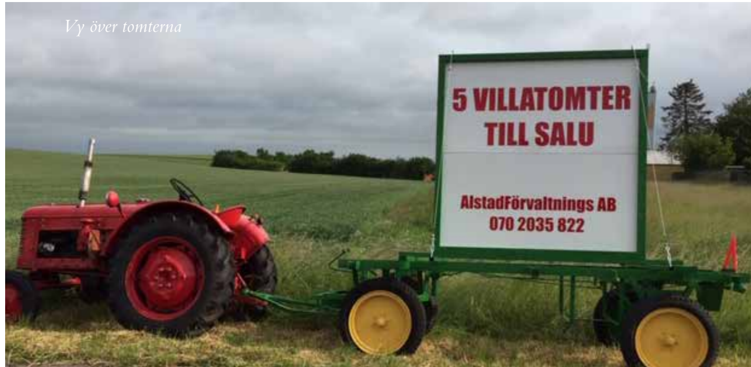
Vy över tomterna

I den lantliga idyllen Alstad finns närhet till både natur och större städer. I den lugna byn finns såväl förskola som skola (F-6) samt ett äldreboende. Vi hittar också ett härligt gatukök, bensinstation och bilverkstad.