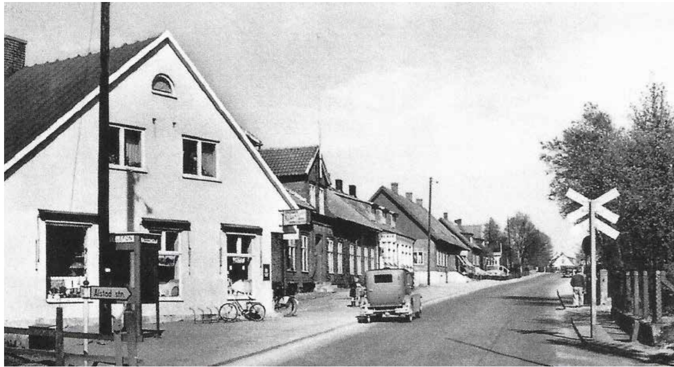
Alstad stationssamhälle har gamla anor och anlades 1875 i samband med att järnvägen gick genom byn. När järnvägen lades ned på 60-talet fortsatte livet i Alstad med gemytligt lantliv. Bilden är tagen under efterkrigsåren.