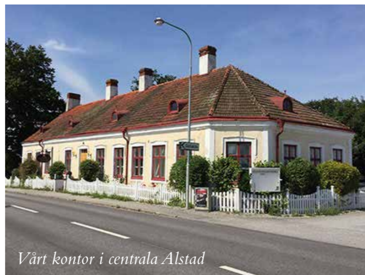
Vårt kontor i centrala Alstad